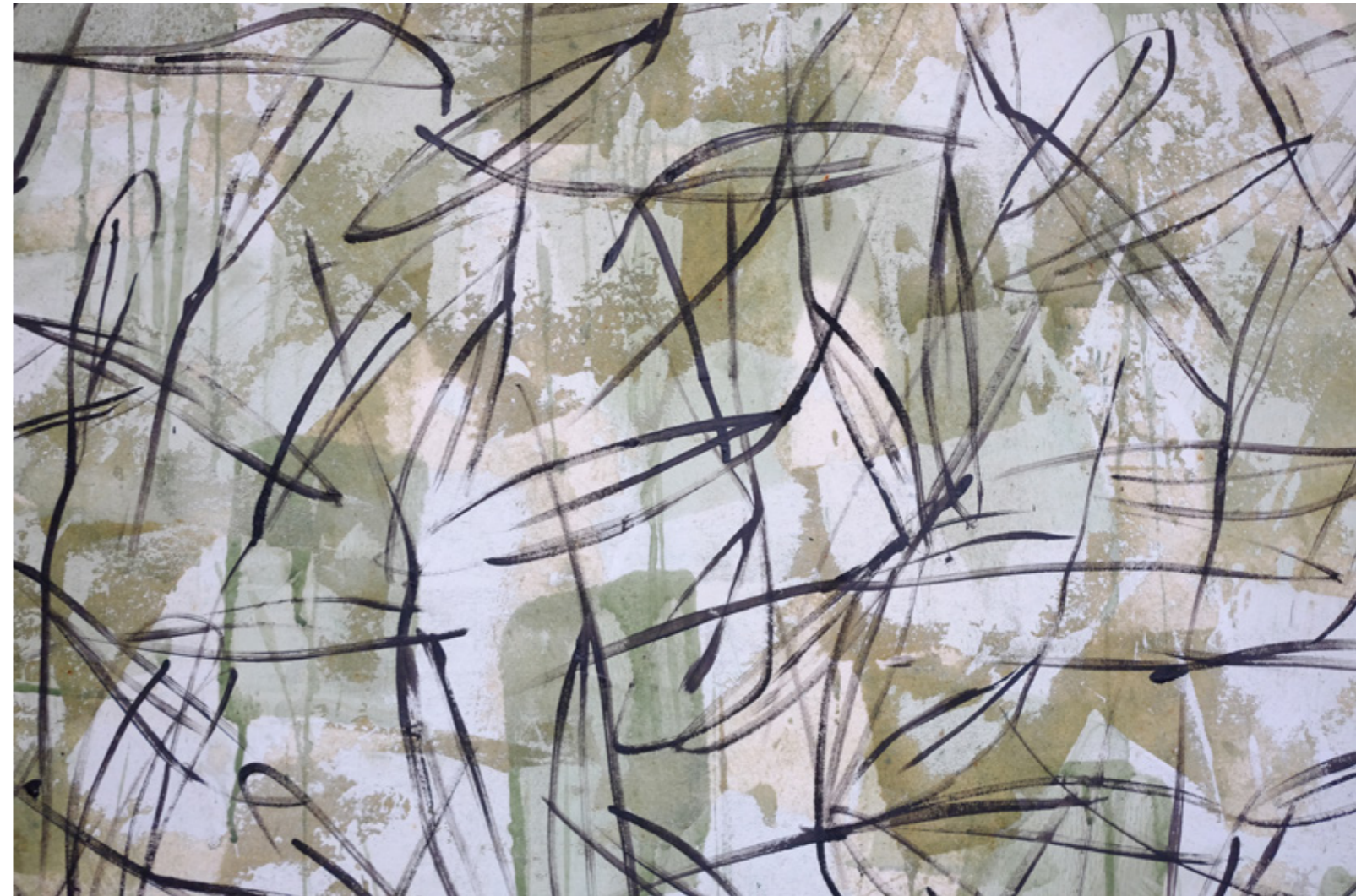
Détail: Le jardin de ma Grand-Mère, 2023, techniques mixtes sur toile 210 cm x 180 cm